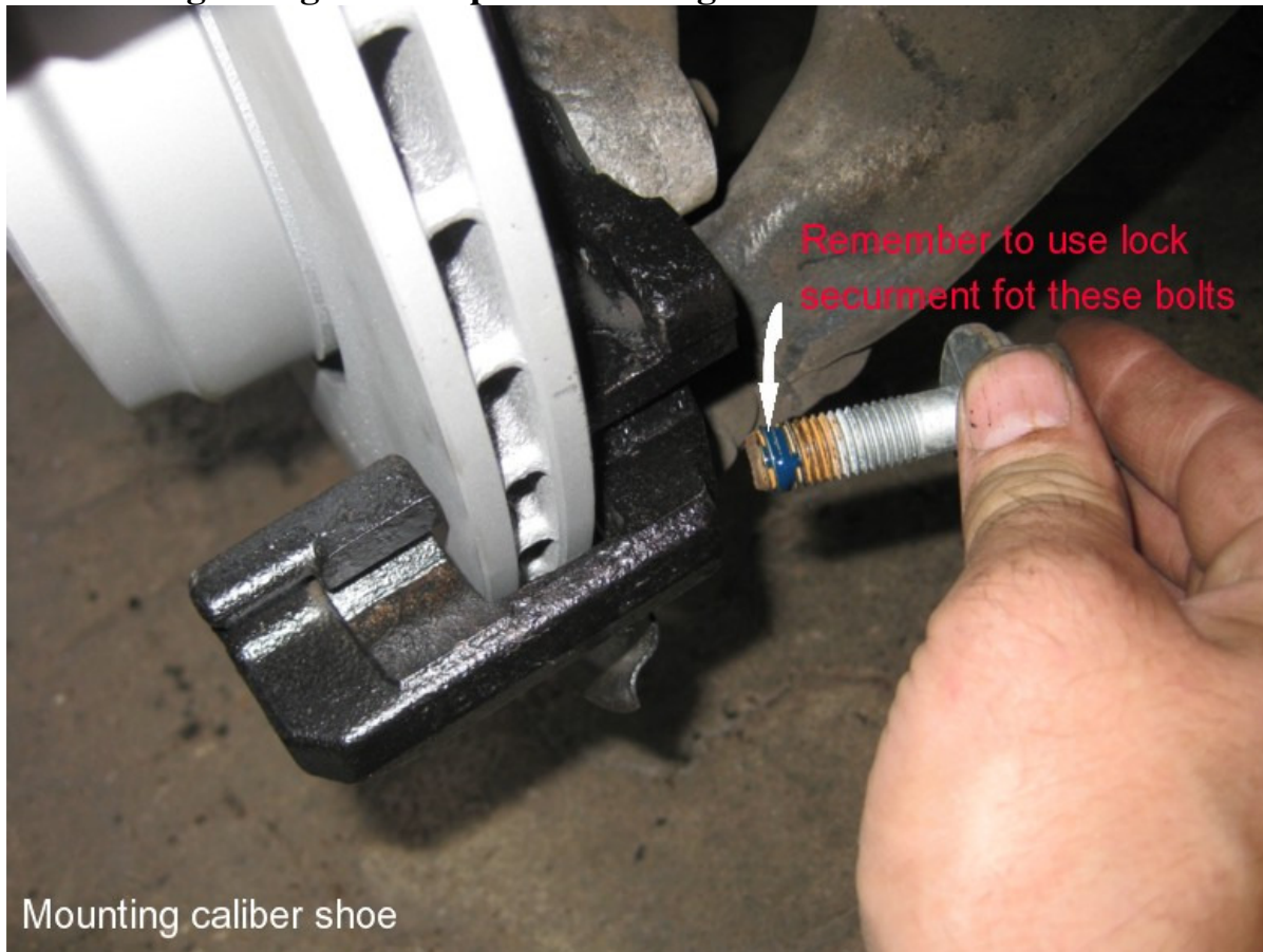
Mounting caliber shoe