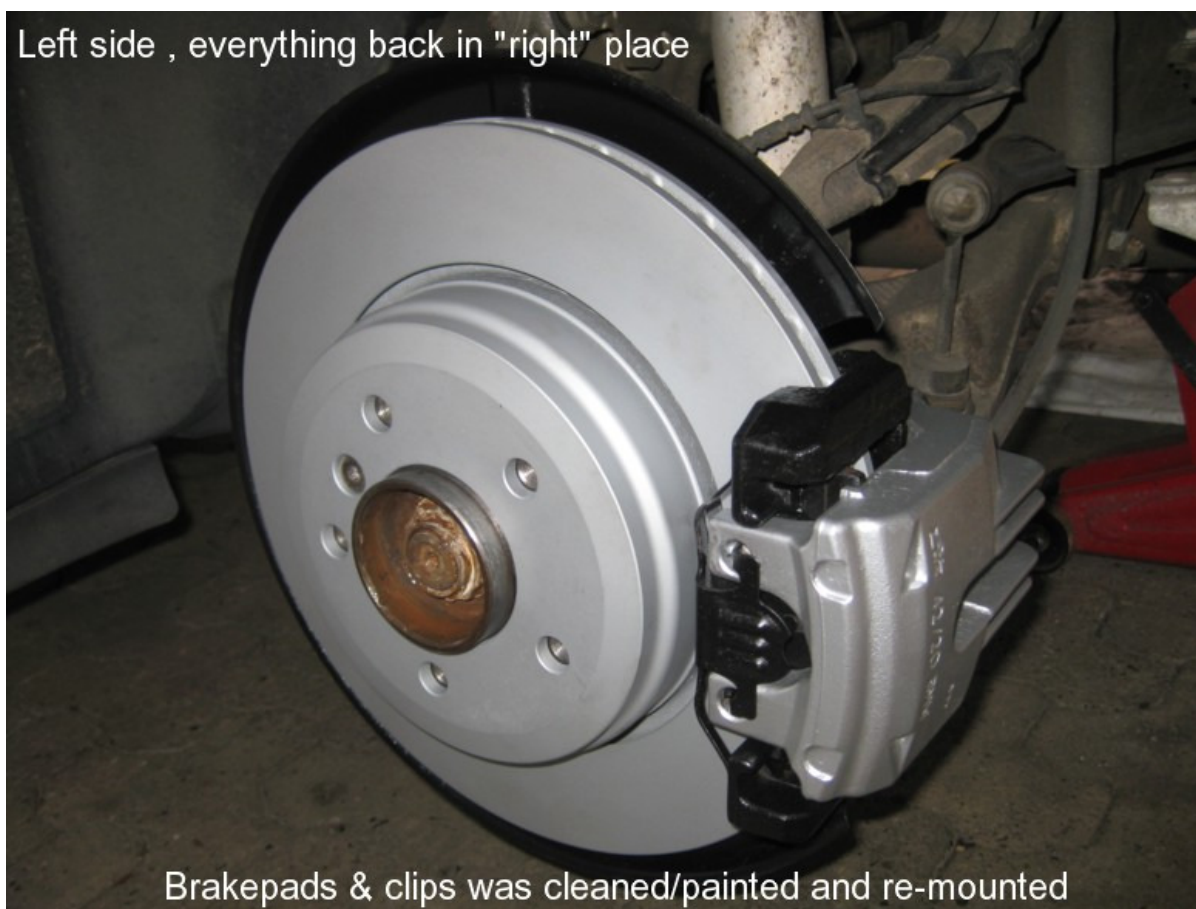
Left side , everything back in "right" place