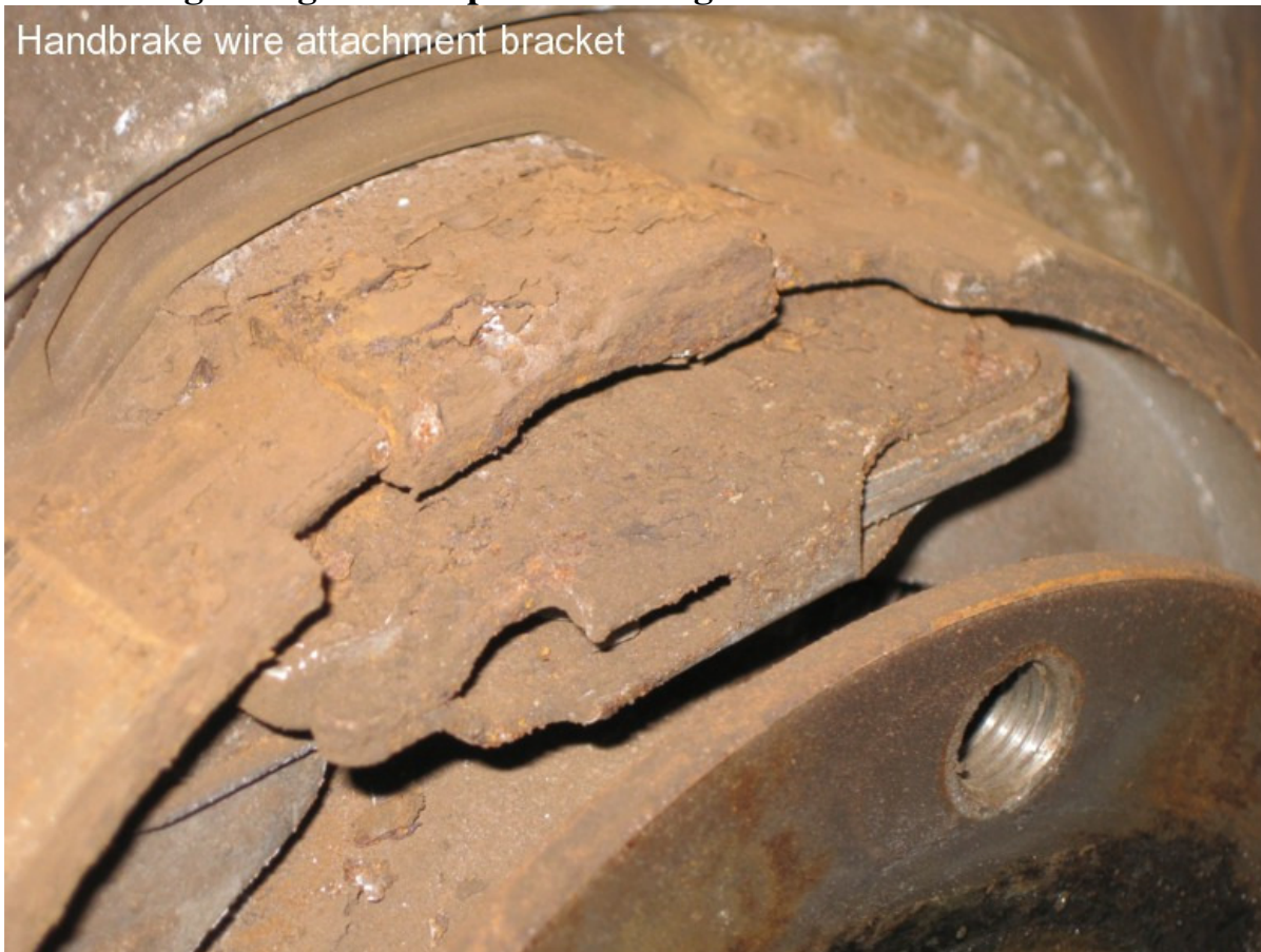
Handbrake wire attachment bracket